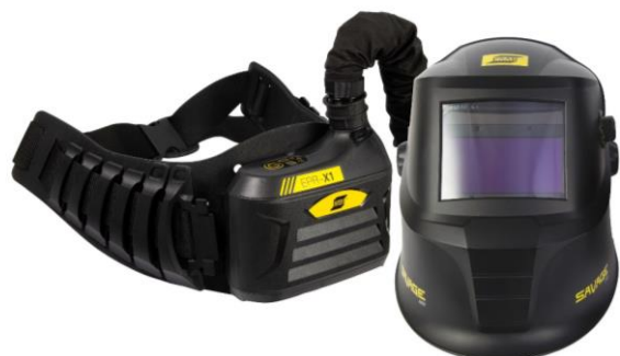
EPR-X1 con pantalla de aire Savage A-40