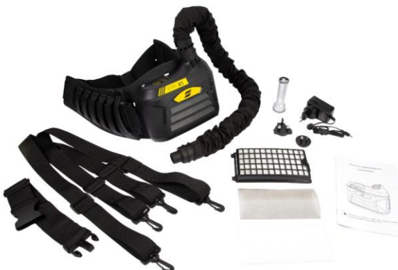
Sistema PAPR EPR-X1