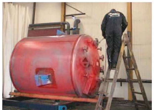
Avesta RedOne™ Pickling Spray 240 – spray pickling with Best Available Technique.